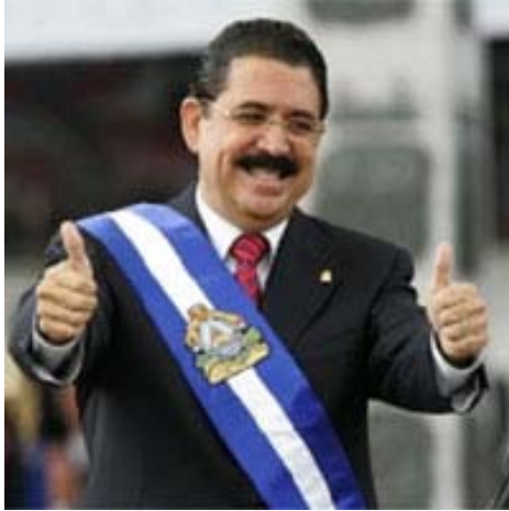
Toma de Protesta de Manuel Zelaya, el pasado 27 de Enero

Con un partido político centenario, los liberales hondureños se aprestan a tomar el mando, una vez más, del Gobierno de la República. Los liberales no solo debemos saber ganar debates y elecciones, sino hacer buenos gobiernos, y este, es el mayor desafío para la nueva Administración liberal en Honduras, sobre todo, tomando en cuenta la arremetida del neopopulismo de izquierda en el sur de América. Honduras es un país con muchas y muy variadas fortalezas para crecer económicamente y superar la pobreza. No hay desarrollo sin libertad y no hay libertad sin desarrollo. El Gobierno de Me/Zelaya debe impulsar reformas y políticas públicas liberales para hacer posible que la sociedad hondureña sea más abierta, más responsable y más próspera y, demostrar que las ideas liberales sí funcionan.